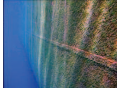
Underwater hull with weed Yosun tutmuş su altı alanı

D enizcilik sektörü yıllardır pratikte uygulanabilir yakıt tasarrufu yöntemlerini arıyor. Yatık tüketimini düşürmenin bir çok yolu var, bunlardan bir tanesi de anti-fouling uygulaması. Geminin su altında kalan alanlarına midye ve yosun gibi deniz canlıları yapışarak geminin hızını düşürür. Anti-fouling boyalar, bu deniz canlılarının (midye ve yosun) yapışmasına engel olarak geminin hız kaybını önüyor ve enerji verimliliği sağlıyor.