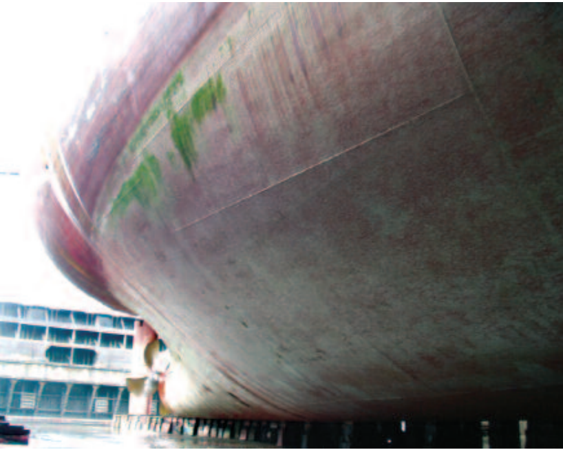
A vessel coated with SPC SPC ile boyanmış bir gemi

This 'Seatrade' Award and Queen's Award winning, biocide free, silicone based technology works on a foul release basis by providing a very smooth, slippery, low friction surface onto which fouling organisms have difficulty attaching. Any which do attach, normally do so only weakly and can usually be easily removed. With proven average fuel savings of 4% and a corresponding reduction in emissions, the painting has become firmly established as the industry benchmark in foul release technology.