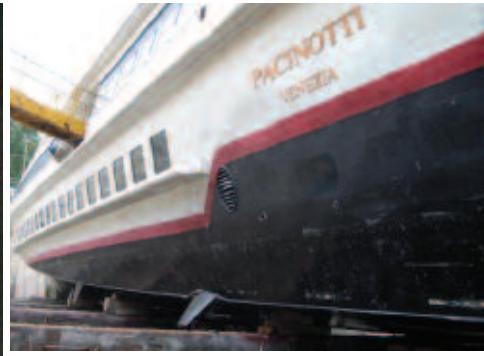
Condition of a fast vessel coated with Intersleek 425, 5 years later.

In terms of reduced CO 2 emissions and improved fuel efficiency, Intersleek 900 offers predicted savings of up to 9% (depending on application and in service conditions) in comparison to