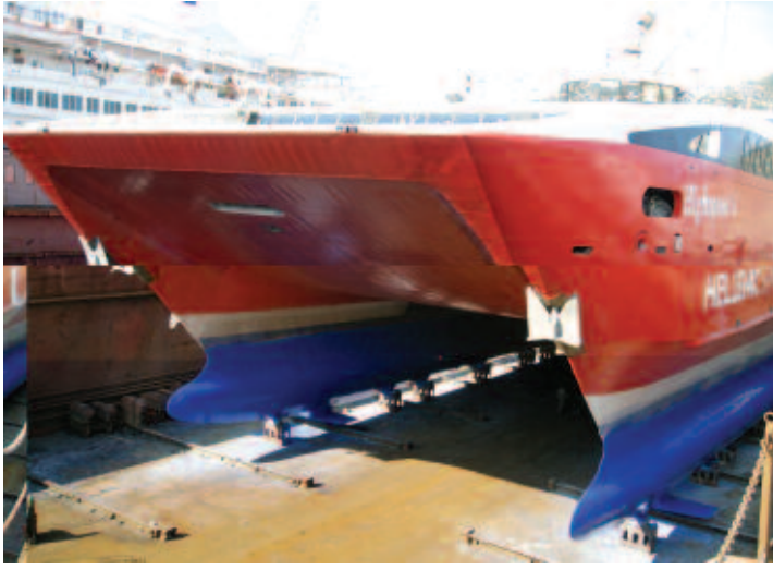
An application of Intersleek 900 Intersleek 900 uygulaması

biocide containing SPC antifoulings. The potential exists for even greater savings in comparison to controlled depletion antifoulings.