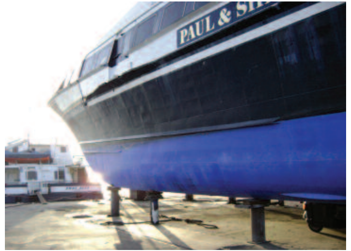
Condition of a fast vessel coated with Intersleek 700, 3 years later. Intersleek 700 ile boyanmış hızlı tekne. Boyandıktan 3 sene sonraki kondisyonu.

Boya, düşük yüzey pürüzlülüğü sayesinde, sürtünme katsayısının en az düzeyde olması ve ileri derecede karakteristik yüzey enerji-