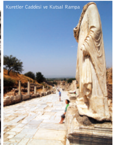
Kureter Caddesi ve Kutsal Rampa