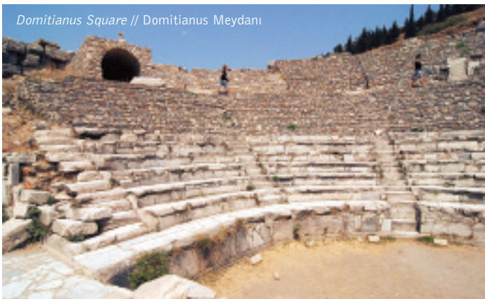
Domitianus Square // Domitianus Meydanı

This fearful and strained period would last until 334 BC, when Alexander the Great overthrew the Persian sovereignty in Asia Minor.