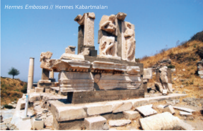
Hermes Embosses // Hermes Kabartmaları

witnessed significant construction activities particularly during the reigns of the emperors Traianus and Hadrianus. Monuments with highly ornamented façade, like Celcus library, were all built in that period. Ephesus thus became the fourth biggest city after Rome, Antioch (Antakya), and Alexandria.