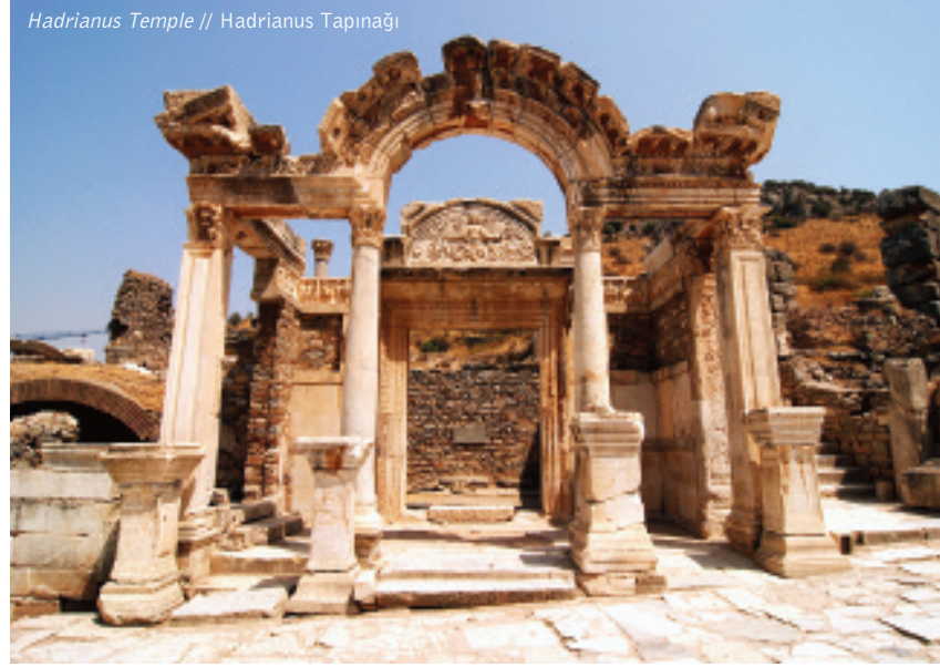
Hadrianus Temple // Hadrianus Tapınağı

Bu söylencenin Ephesoslular için ne denli önemli olduğu balık ve yaban domuzunu kutsal saymaları ve tedavül ettikleri sikkelerde bu sembolleri kullanmalarından da anlaşılır.