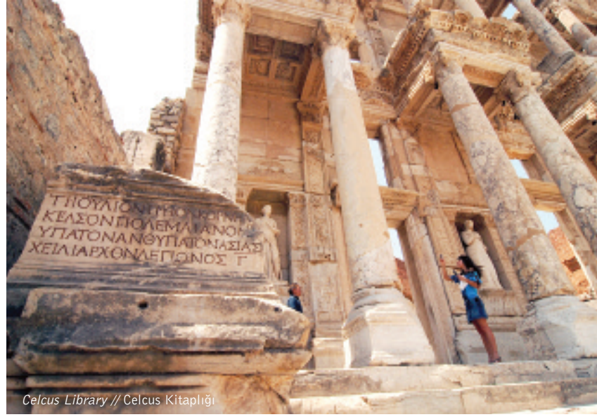
Celcus Library // Celcus Kitaplığı

There are niches on the walls, which served as shelves for book rolls, and a marble sarcophagus for Celcus in a room behind the building. Sometimes, some historical works express themselves easily, without requiring much word about them. Ephesus is also such a magical place. We wish that everyone would have the chance to see this magnificent ancient city. ☘