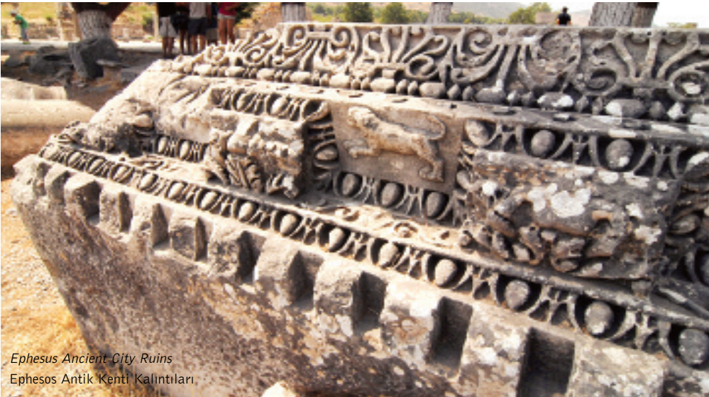
Ephesus Ancient City Ruins Ephesos Antik Kenti Kalıntıları

İÖ 133'ten itibaren Anadolu'nun büyük bir kısmı ile birlikte Roma İmparatorluğu egemenliğine giren Ephesos İS 1. ve 4. yıllar arasında "Altın Çağını" yaşar. İmparator Augustus döneminde Asia