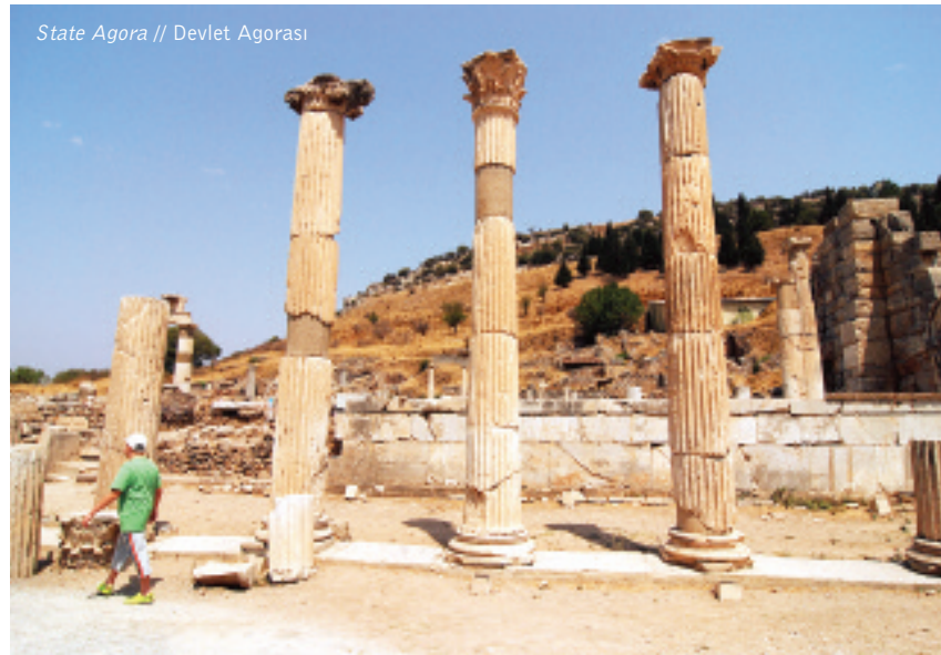
State Agora // Devlet Agorası

Hiçbir şey durduğu yerde durmaz. Tarihin sayfalarında gezindikçe bu söylemin doğruluğu da kendisini hep teyit eder. İÖ 546 yılına gelindiğinde İonia uygarlığı Pers istilasına uğrar. Ephesus bu dönemleri hep Pers korkusu ve baskısı altında geçirir.