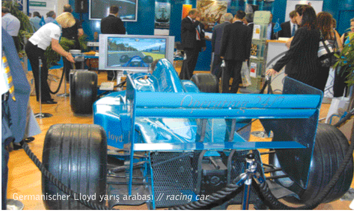
Germanischer Lloyd yarış arabası // racing car