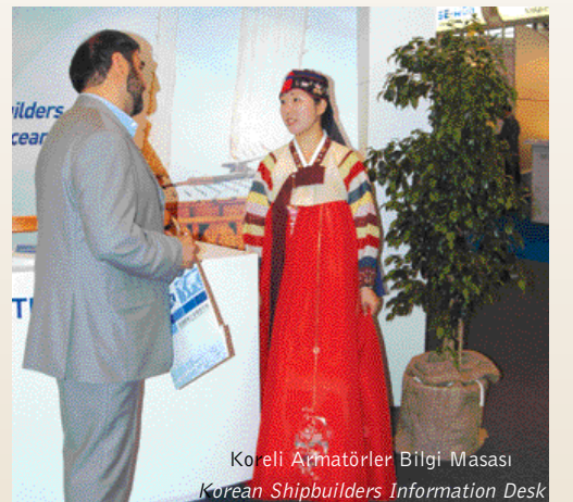
Koreli Armatörler Bilgi Masası Korean Shipbuilders Information Desk