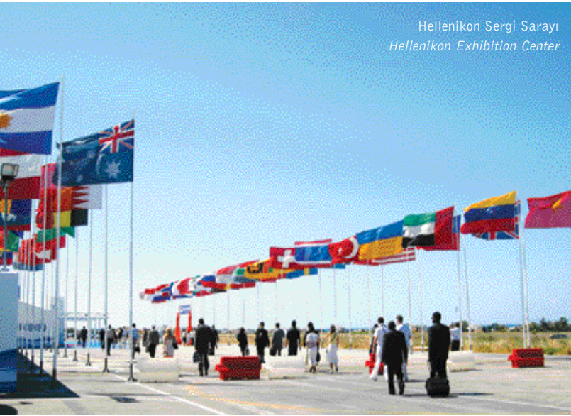
Hellenikon Sergi Sarayı Hellenikon Exhibition Center

A çılışı Dünya Çevre Günü'nde yapılan fuar, alan ve ülke katılımı itibariyle bugüne kadarki en büyük Posidonia fuarı oldu. Fuar ilk defa, daha önceki fuar alanı Pire Liman İşletmelerindeki güvenlik sorunundan dolayı Hellenikon Sergi Sarayı'nda yapıldı.