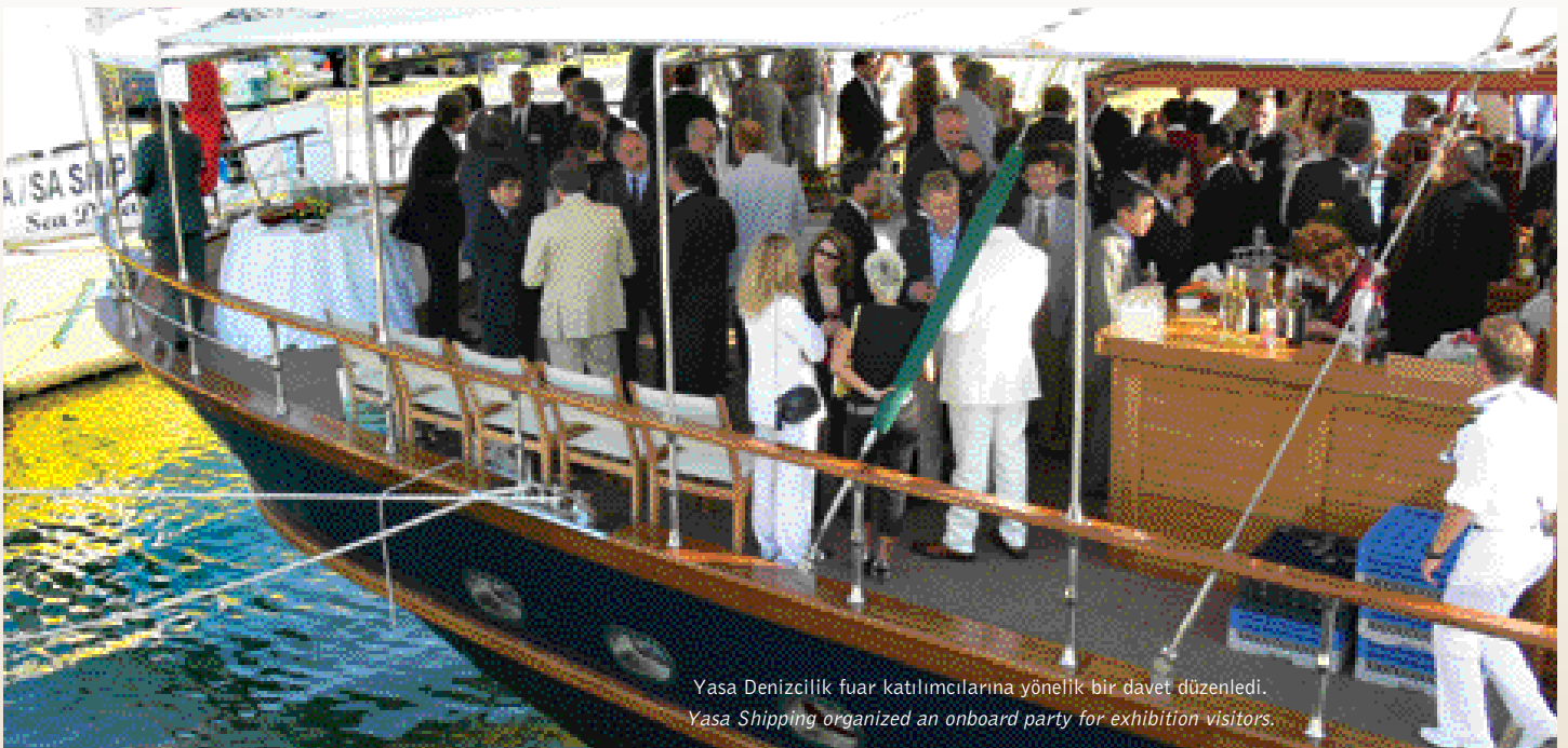
Yasa Denizcilik fuar katılımcılarına yönelik bir davet düzenledi. Yasa Shipping organized an onboard party for exhibition visitors.