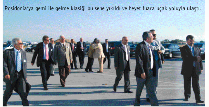
Posidonia'ya gemi ile gelme klasiği bu sene yıkıldı ve heyet fuara uçak yoluyla ulaştı.