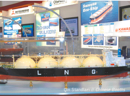
Çin Standları // Chinese Booths