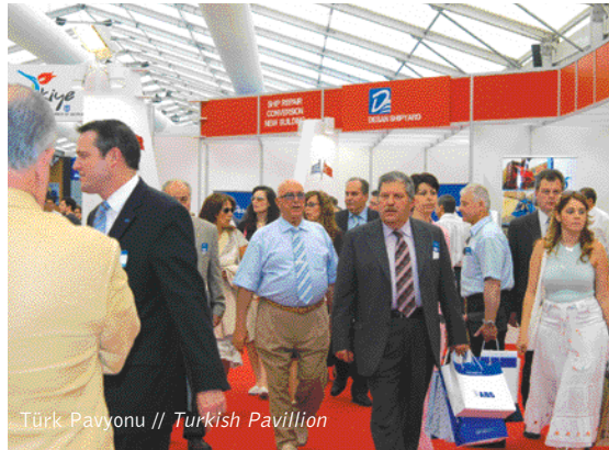
Türk Pavyonu // Turkish Pavillion