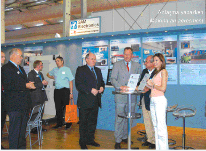
Anlaşma yaparken Making an agreement