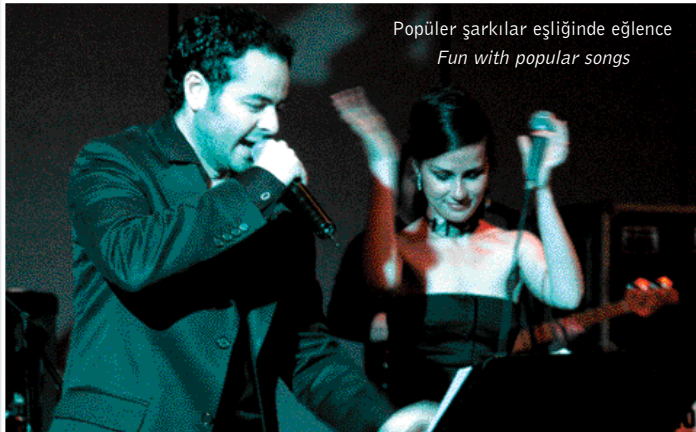
Popüler şarkılar eşliğinde eğlence Fun with popular songs