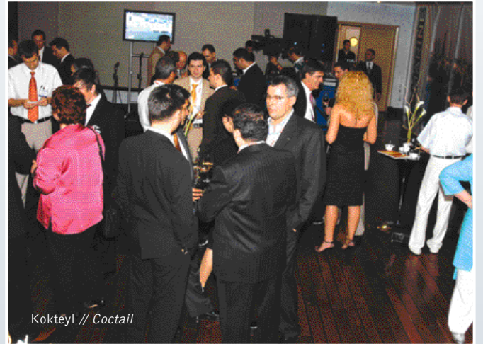
Kokteyl // Coctail