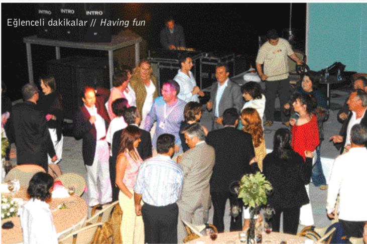
Eğlenceli dakikalar // Having fun