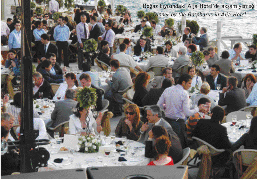
Boğaz kıyısındaki Aija Hotel'de akşam yemeği Dinner by the Bosphorus in Aija Hotel