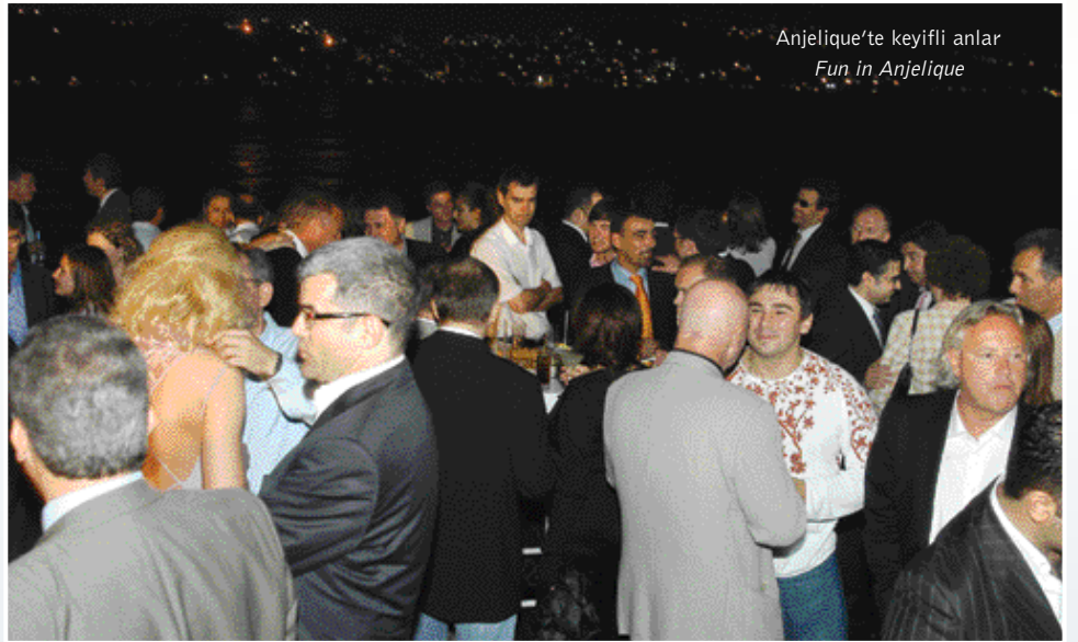
Anjelique'te keyifli anlar Fun in Anjelique