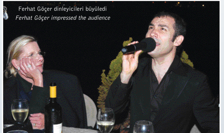
Ferhat Göçer dinleyicileri büyüledi Ferhat Göçer impressed the audience