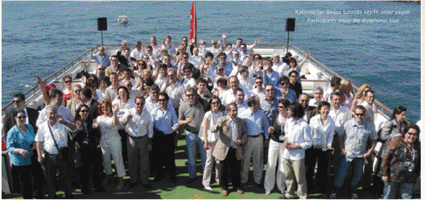
Katılımcılar Boğaz turunda keyifli anlar yaşadı Participants enjoy the Bosphorus tour