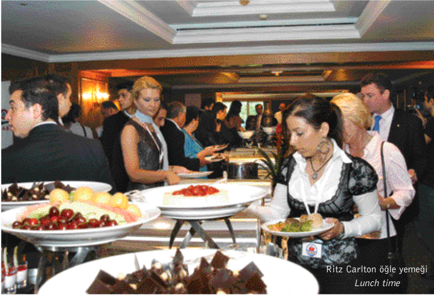
Ritz Carlton öğle yemeği Lunch time